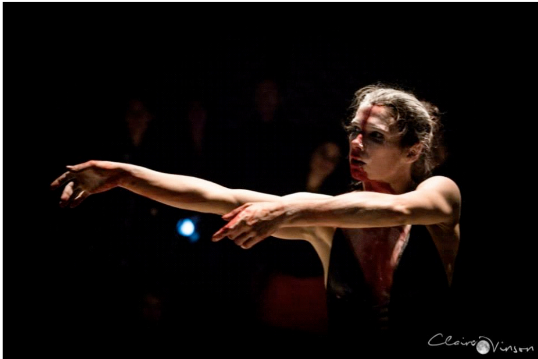
HYPNAGOGIK AUSSEHEN